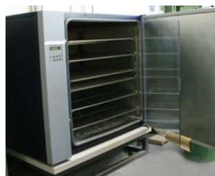
Laborofen für Prüfaufgaben und Testprogramme