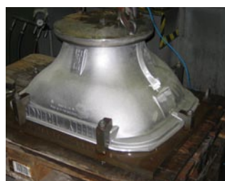
Kundenprüfstand zur Gehäuseprüfung auf Dichtheit